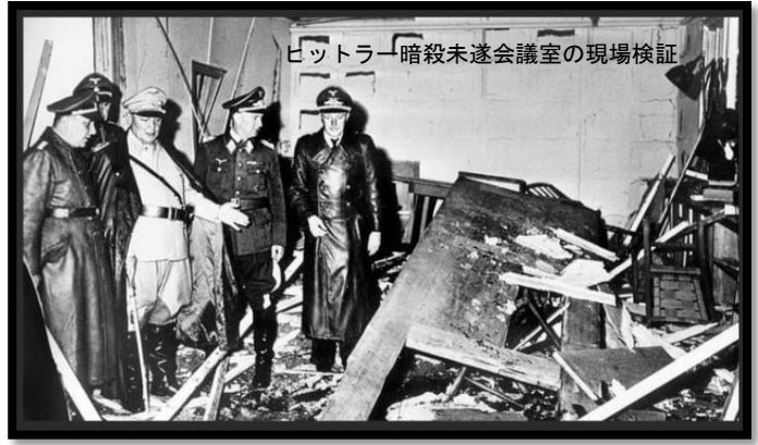
ヒトラー暗殺未遂会議室の現場検証