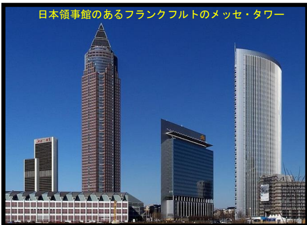
日本領事館のあるフランクフルトのメッセ・タワー