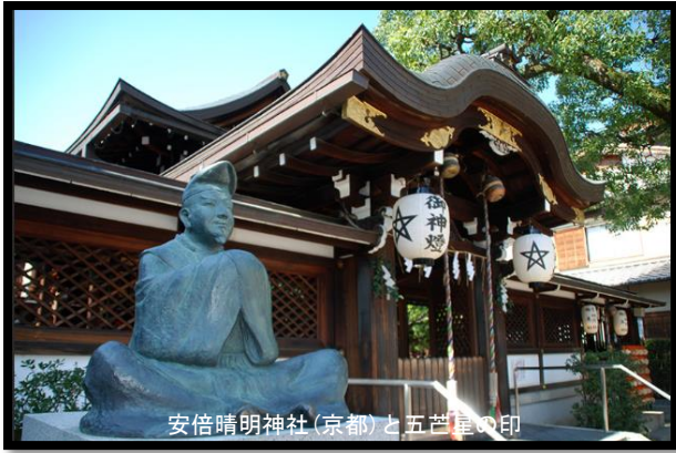
安倍晴明神社(京都)と五芒星の印