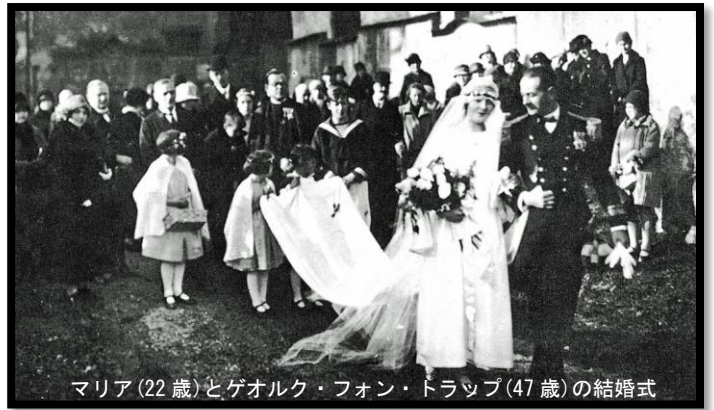
マリア(22歳)とゲオルク・フォン・トラップ(47歳)の結婚式