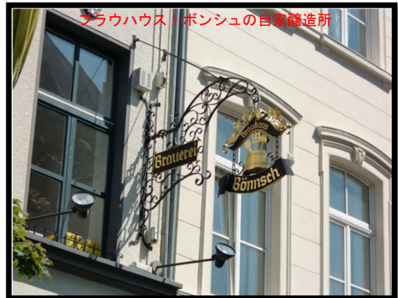
ブラウハウス・ボンシュの自醸醸造所