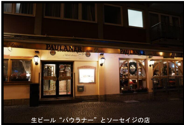
生ビール“パウラナー”とソーセイジの店