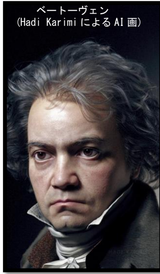
ベートーヴェン (Hadi Karimi による AI 画)