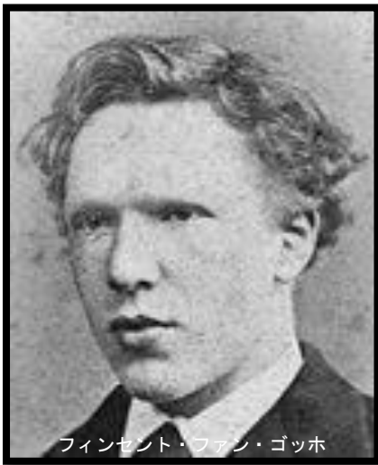
フィンセント・ファン・ゴッホ