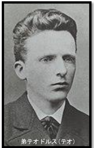
弟テオドルス(テオ)

《ひまわり》 (SOMPO 美術 館蔵)1888 年 8 月に描いた 最初の《黄色 い背景のひ まわり》(ロ ンドン、ナシ ヨナル・ギャ ラリー蔵)を もとに、ゴー ギャンとの 共同生活の 時期に描か れた作品。