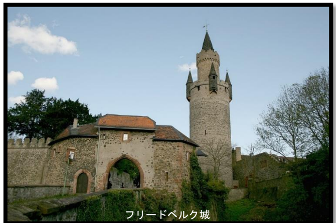
フリードベルク城