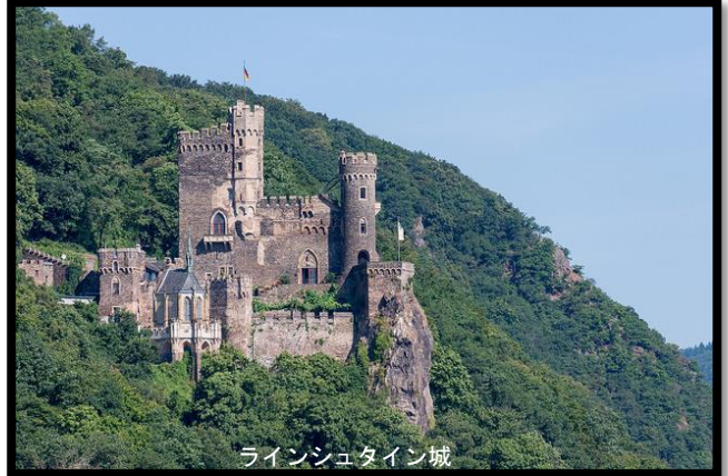
ラインシュタイン城