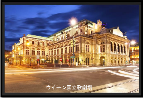
ウィーン国立歌劇場