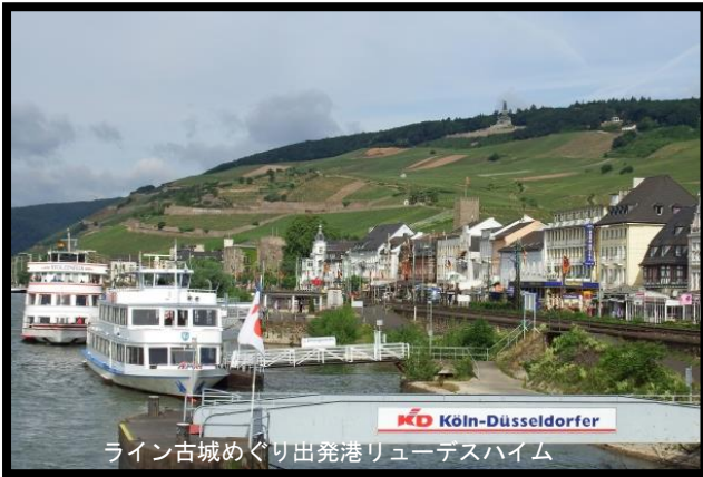
ライン古城めぐり出発港リュエデスハイム