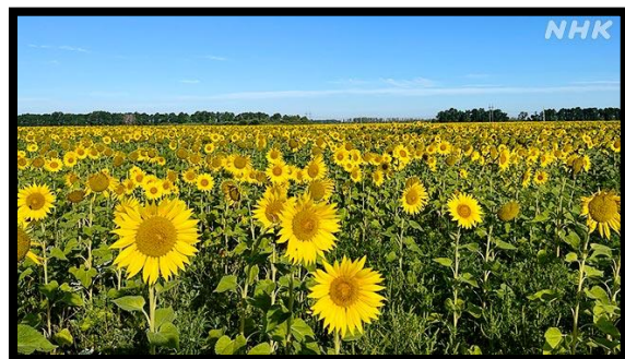
NHK 報道局記者 別府 正一郎氏「ひまわりは枯れたけれど ウクライナの希望は消えない」