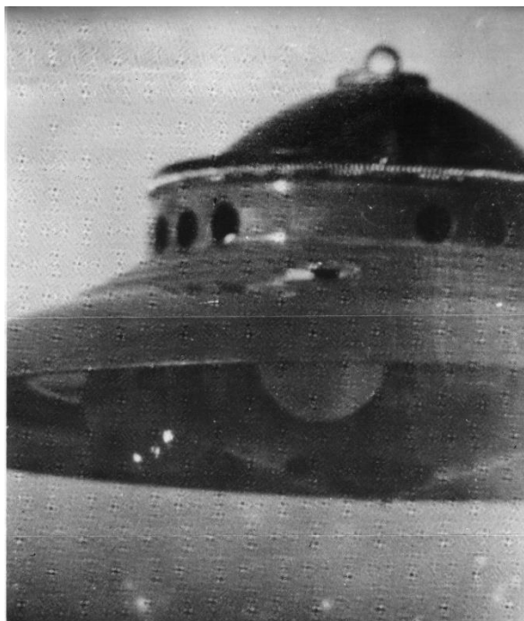
上 金星の円盤(1) 1982年12月13日午前9時10分頃、米カリフォルニア州パロマー山脈のパロマー・ガーデンス台地で、ジョージ・アダムスキーが6インチ反射望遠鏡で撮影した金星のスクワット・シップ(観測船)直径約10メートル。この写真を撮影後、円盤はアダムスキーの機上へ飛来してネガホルダーを投下した。

ワレらの科学水準は相当に高度なものになりました。その成果の一つは宇宙空間移動を可能にしたことです。この技術によって、現在は多くのマーフォークが別の太陽系に移住しています。宇宙空間移動船すなわち宇宙船は人族に目撃されることがあり、それは UFO(未確認飛行物体 Unidentified Flying Object)とか UAP(未確認空中現象 Unidentified Aerial Phenomenon)と呼ばれていますが、この騒ぎに便乗した怪しげな UFO 写真も広がり、ワレらは啞然としています。UFO 写真も時代と共にデザインがエレガントになっています。アダムスキーが報告した初期の UFO は「海底 2 万マイル」のノーチラス号のように 19 世紀末のクラシックなゴツゴツしたデザインでした。最近の UFO はスムーズなデザインで、さらに光だけで形すら見えなくなっています。ワレらの宇宙船はこの半世紀の間でデザイン的にはそれほど変化していません。ただ目撃されないように工夫はされて